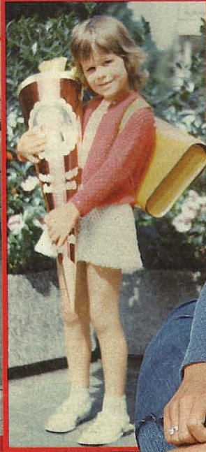
1972 Als Abc-Schützin mit Schultüte und Ranzen auf dem Rücken